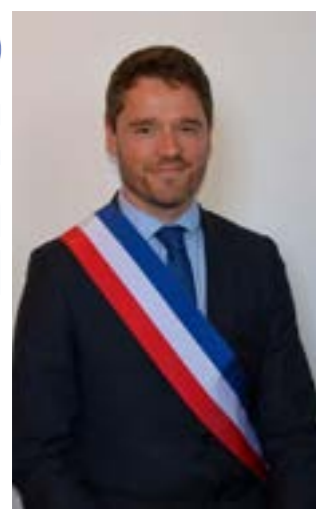
Grégory LELONG Maire de Condé-sur-l'Escaut

Prochain comité culturel : mardi 16 mars à la Médiathèque Le Quai